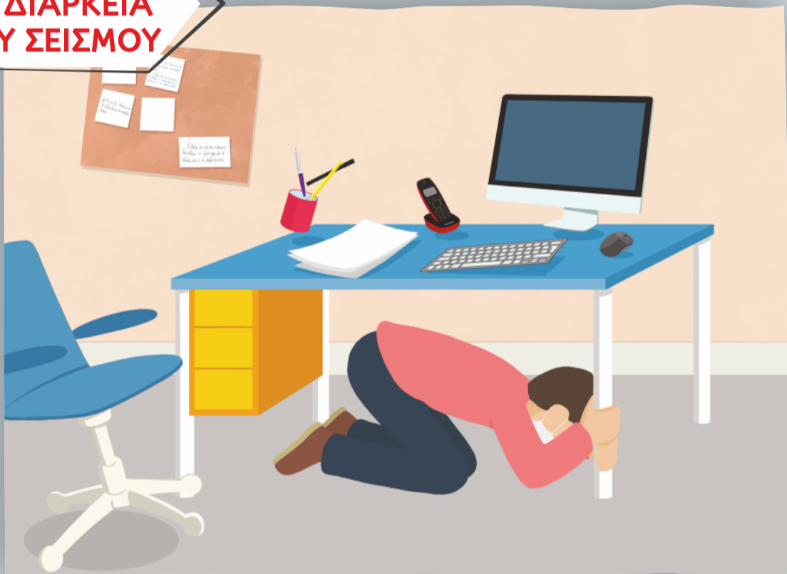
Κάλυψη κάτω από γραφείο κρατώντας το πόδι του