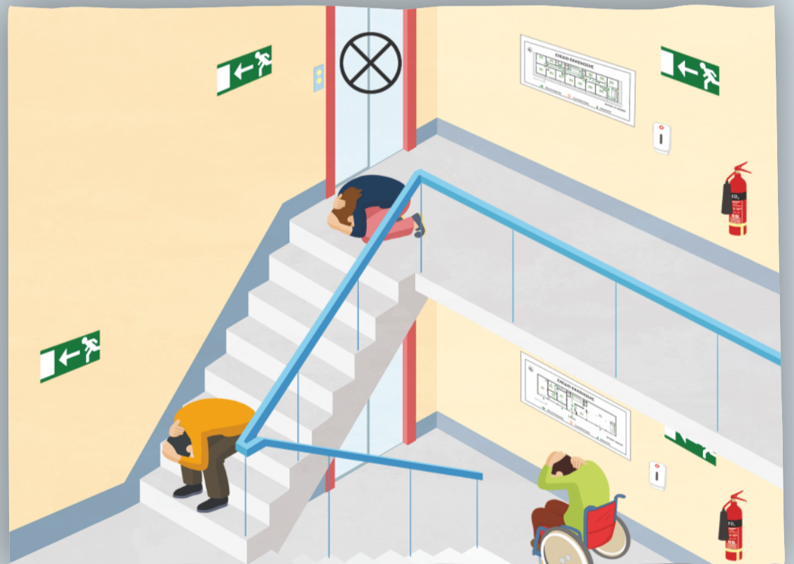
Αποφυγή μετακίνησης. Μείωση του ύψους και κάλυψη