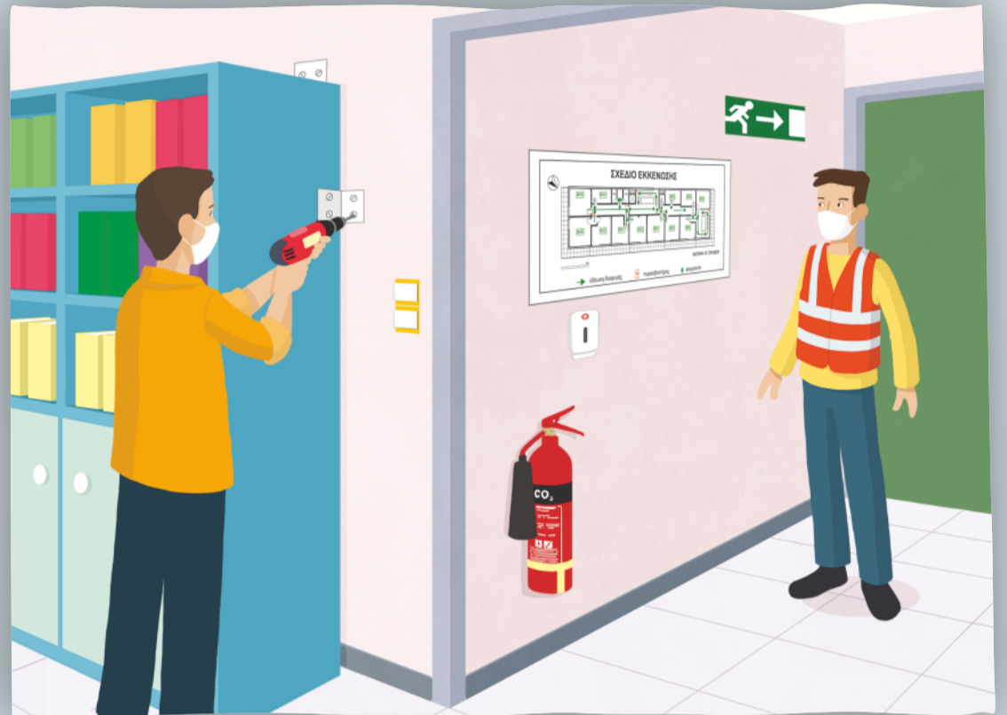
Επισήμανση και άρση επικινδυνότητας