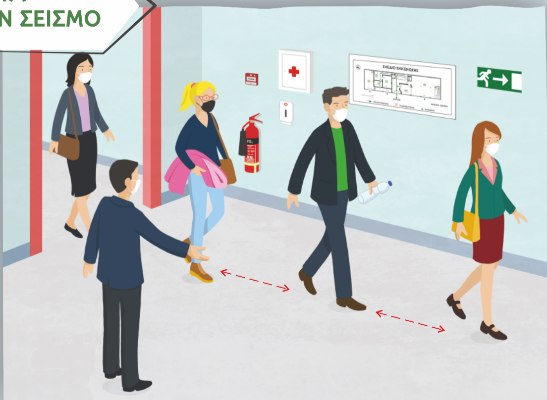
Εκκένωση κτιρίου με ψυχραιμία